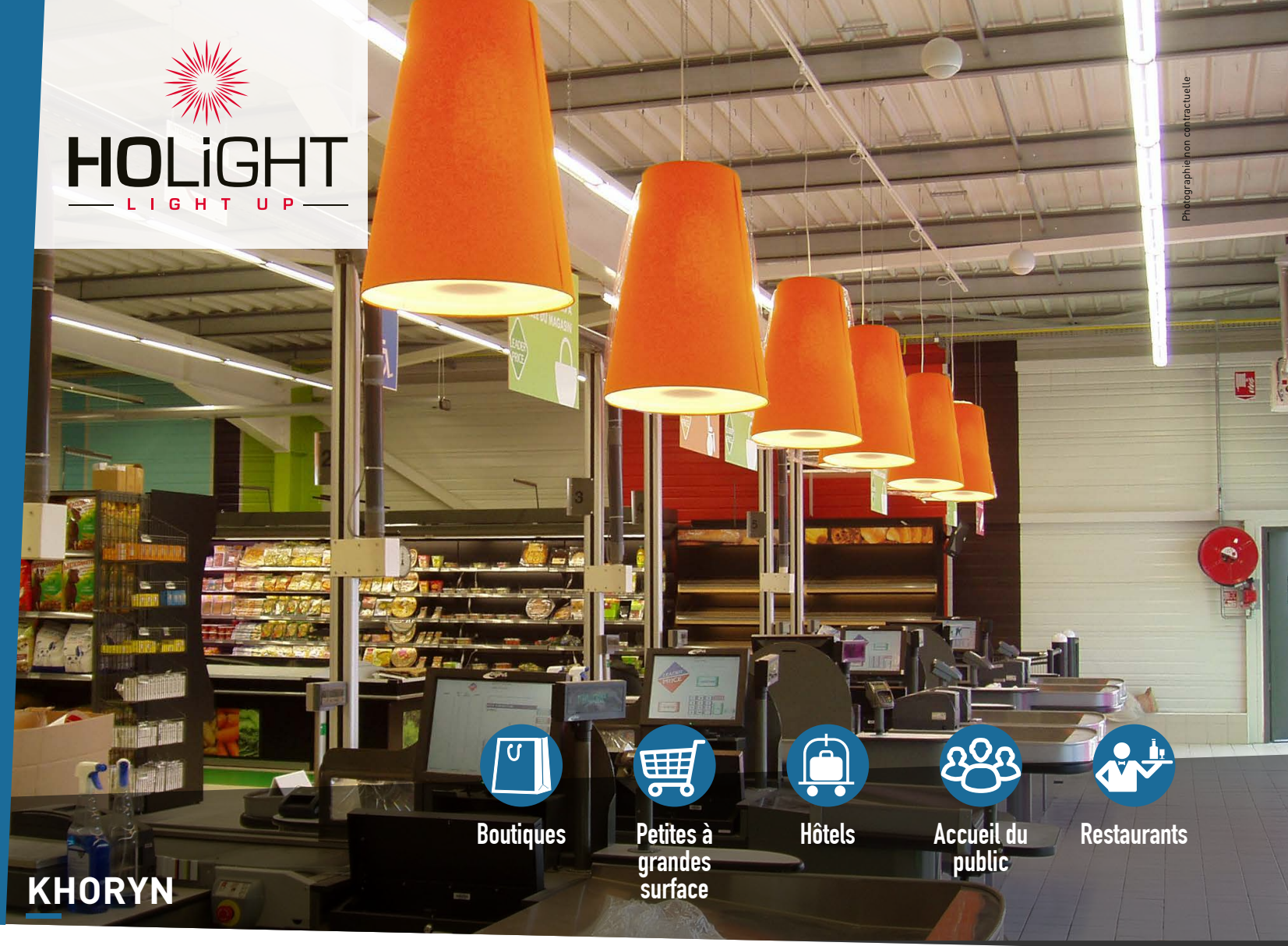
Photographie non contractuelle