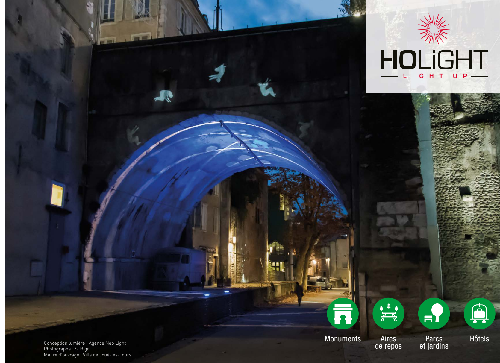
Conception lumière : Agence Neo Light Maître d'ouvrage : Ville de Joué-lès-Tours