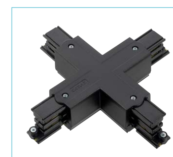
Jonction en croix