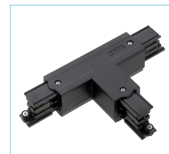
Jonction en T