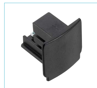
Embout de fermeture