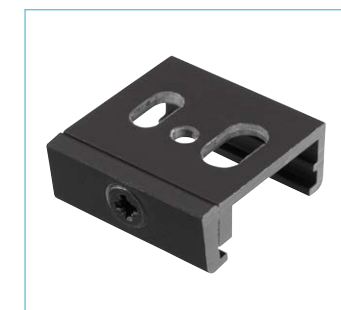
Fixation pour plafond