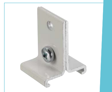
Fixation pour suspensoir (Coloris blanc et aluminium uniquement)